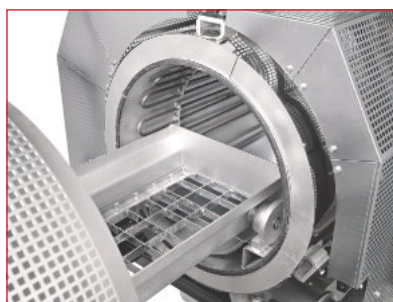
Gaveta de carga