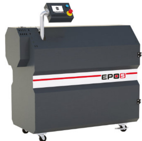
Forno de pirólise ECON para roscas para extrusoras, EPOS