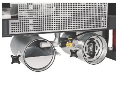
Recipiente de recolha e de condensação