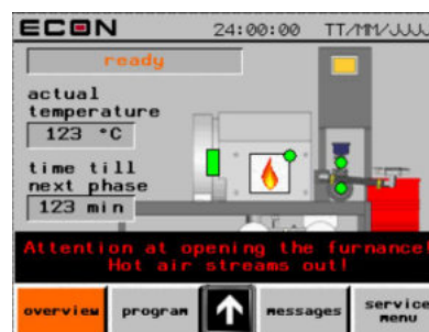
Operação através de tela tátil